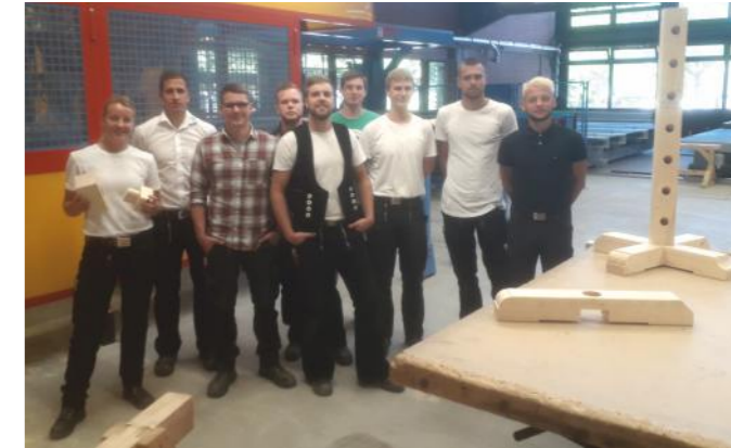
Beim Einstieg in die CNC-Technik und beim Ausprobieren der Möglichkeiten entstehen allerhand nützliche „Abfallprodukte“ ...